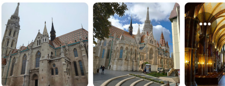
Église Notre-Dame de l'Assomption de Budavár

Afin de simplifier l'ensemble de tes déplacements quand tu seras sur place, j'ai créé une liste de tous les lieux à connaître directement sur Google Maps.